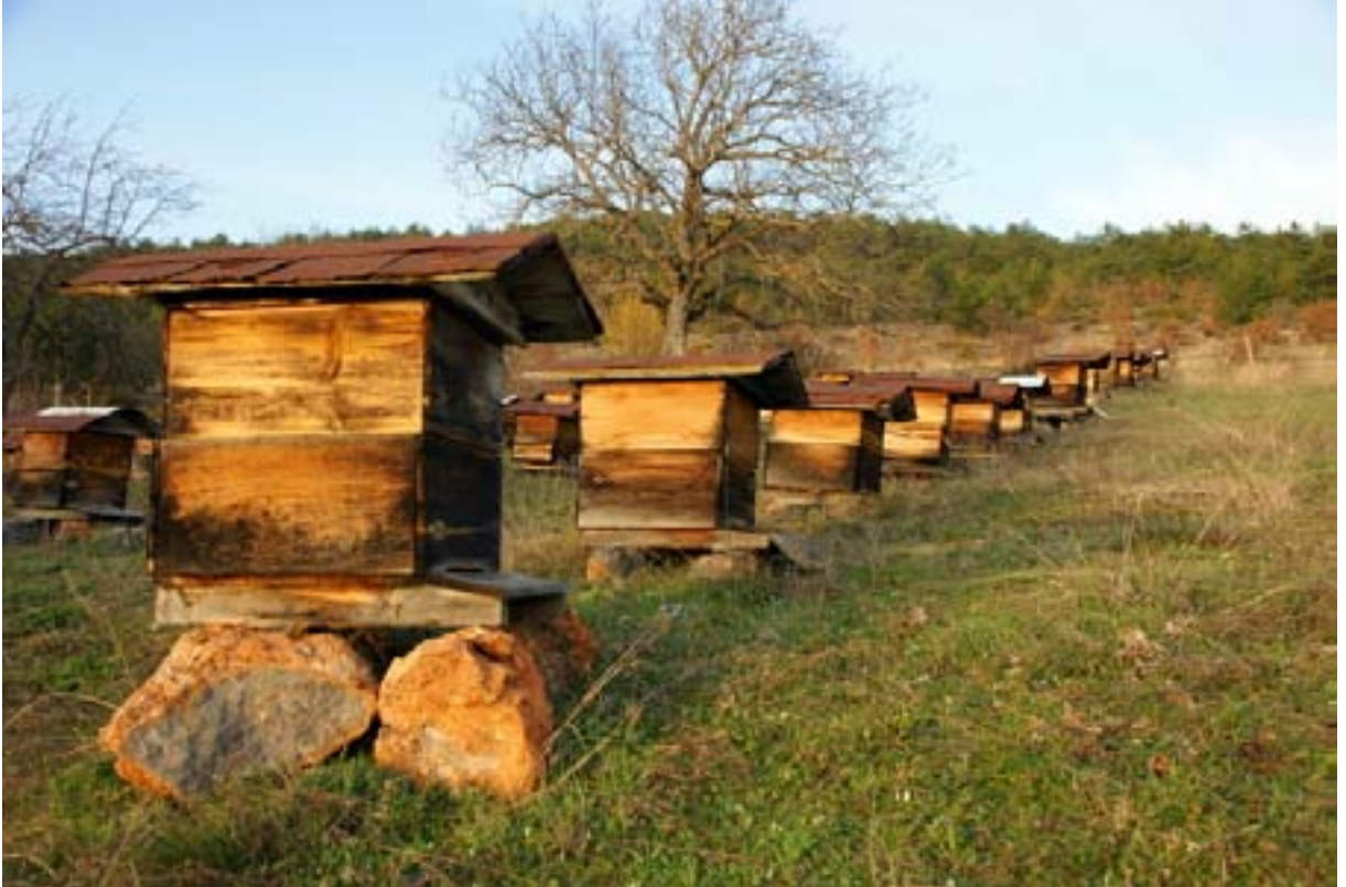
Çırdak köyü-Mengen, Bolu