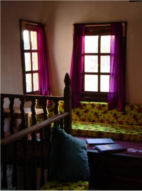
Yanık Ali Konağı, Başören Köyü, Azdavay

Azdavay'ın içinden geçerek Çatak kanyonuna giden patika yolun başına kadar araçla gidiyoruz. Yaklaşık bir km uzunluğunda karışık orman içinden yürüdükten sonra Çatak kanyonuna hâkim noktaya saat 16.15 gibi ulaşıyoruz. Kanyon çok görkemli ve oldukça etkileyici. Buradan, daha uzakta Valla kanyonunu da görebiliyoruz.