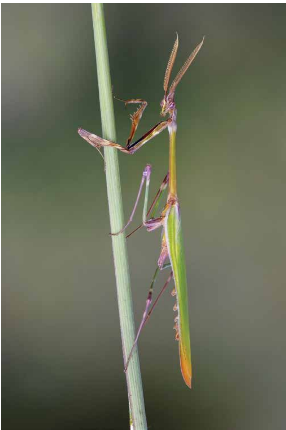
Ayn Fotoğrafı: Hasan ÖZCAN