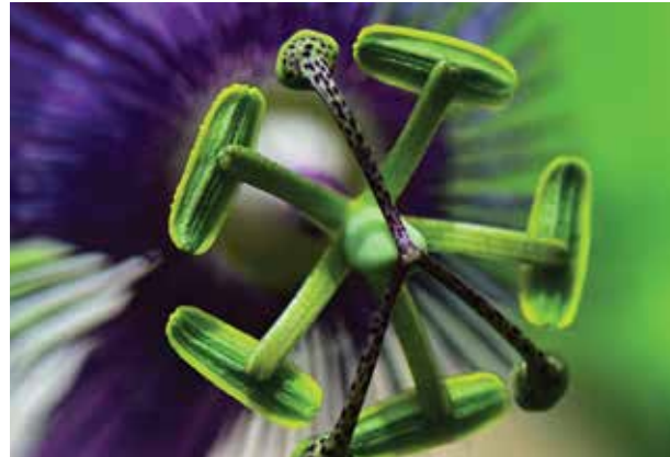
Başarılı Fotoğraf: Filiz KÖPRÜLÜ