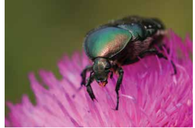
Başarılı Fotoğraf: Hasan ÖZCAN