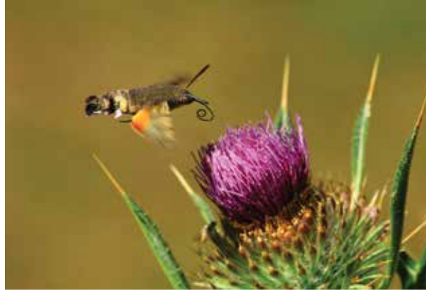
Başarılı Fotoğraf: Hasan ÖZCAN