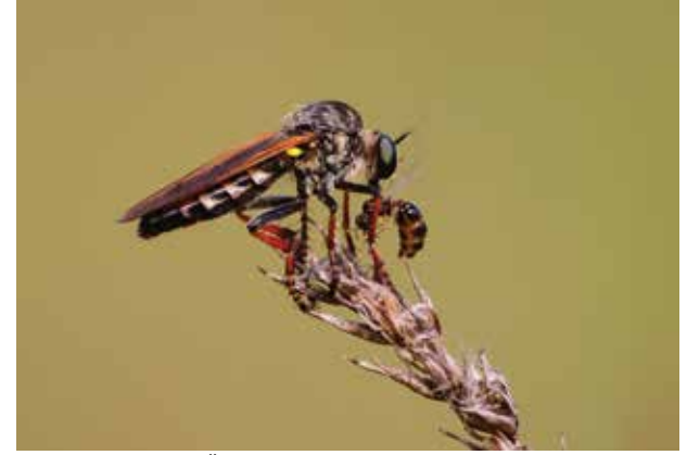
Başarılı Fotoğraf: Hasan ÖZCAN