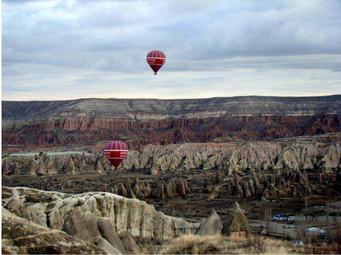
Zelve vadisi ve Aktepe-Kapadokya

Evet, balonun habercisi olan beklediğimiz oda telefonlarımız bu kez 06.00'da çalışıyor, yaşasın! Söylendiği gibi saat 06.30 gibi lobide toplanıp bizi balon pistine götürecek balon şirketinin aracını beklemeye koyuluyoruz. Lobide beklerken bu kez gelen başka bir telefon bu heyecanımızı kursağımızda bırakıyor; hava rüzgarlı olduğu için balon etkinliğinin olmayacağını bildiriliyor. Balon işi balonlaşıyor. Hazır uyanmış ve sıkı giyinmişken üstümüzdekileri çıkarmak için harcayacağımız enerjiyi fotoğraf için harcamanın fotoğrafçılara özgü bir düşünce olduğunu biliyoruz ve balon umutları olanlarla birlikte gün doğumunu yakalamak için Göreme'ye gidiyoruz.