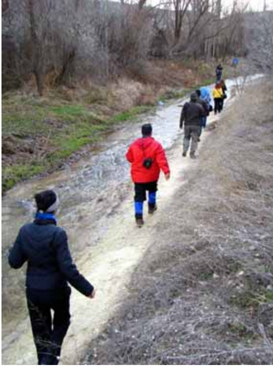
Gemil deresi ve vadisi

Bu sefer Gemil deresinin içinden aktığı vadiye gidiyoruz. Hava kapalı. Araçımızla vadinin girişine kadar girip buradan yürümeye başlıyoruz. Saat 15.10'da başladığımız yürüyüşümüz yaklaşık bir saat sürüyor. Gemil deresinin şekillendirdiği vadinin kenarlarında güvercinlikler ve insan eli ile açılmış su kanalları bulunuyor. Kışın çıplaklığında bu halde olan vadinin ilkbahar ve sonbahardaki güzelliğini hayal edebiliyoruz. Dere kenarından çıkan maden suyunu da tattıktan sonra araçlarımızın olduğu noktaya geri geliyoruz.