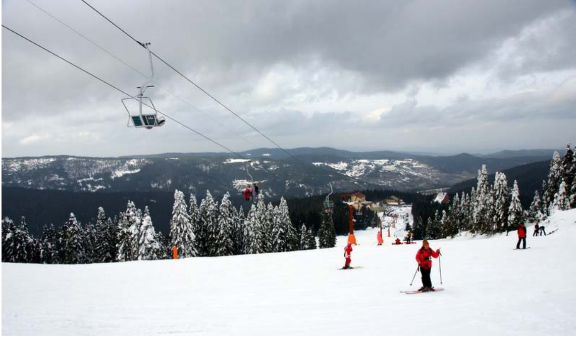
Ilgaz kayak pisti

Yemek ve ardından içilen çay sonrası katılımcıların bir kısmı oteller bölgesini keşfetmeyi tercih ederken bir grup da yürümeyi yeğliyor, Ayla Hanım ise kaymaktan yana. Onbir kişilik bir grupla biz, telesiyeyi kullanarak yukarıya çıkıp yürüyüşe başlamak istesek de telesiyeyde oluşan uzun kuyruktan dolayı yürüyüşe pist başından başlamak zorunda kalıyoruz. Derin kar ve geçit vermeyen ağaçlardan dolayı pistin kenarından dikkatlice yürüyoruz.