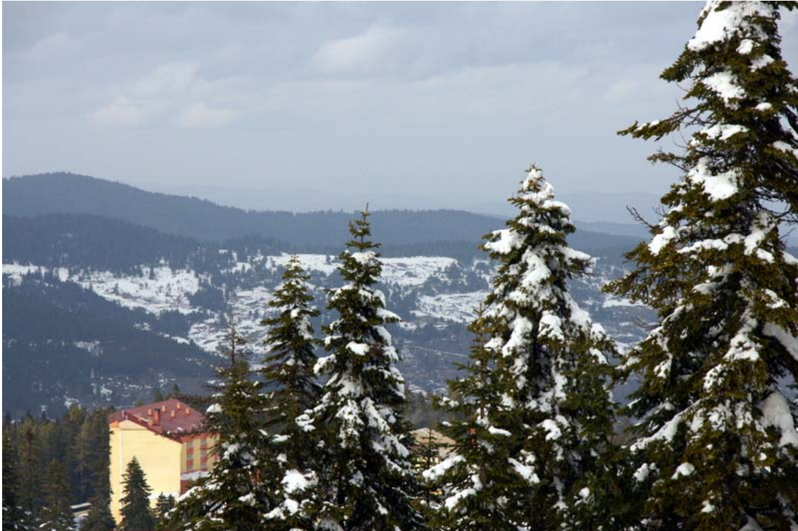
Oteller bölgesi, Ilgaz

Saat 11.00 gibi oteller bölgesine ulaşıyoruz. Üs olarak kullanacağımız Ankara Üniversitesinin Örsem tesislerine yerleşerek fazlalık eşyalarımızı burada bırakıyoruz. Yemek öncesi etrafı keşfetmek ve biraz da hareket etmek için kısa bir “yemek öncesi yürüyüşüne” çıkıyoruz. Ana pistin alt kenarından yürüyerek yan taraftaki küçük pistin sınırına kadar gidiyoruz. Kar bayağı derin, kısa bir yürüyüş yapmış olsak bile bir hayli zorlanıyoruz. Yürüyüşün ardından Örsem tesislerine geri dönerek açık büfe olan menüden yiyeceğimizden fazlasını yiyoruz.