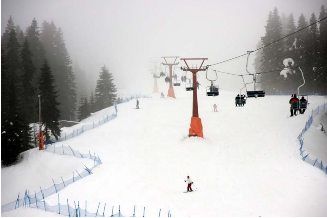
Ilgaz kayak pisti

Saat 11.00 gibi oteller bölgesine ulaşıyoruz. Üs olarak kullanacağımız Ankara Üniversitesinin Örsem tesislerine yerleşerek fazlalık eşyalarımızı burada bırakıyoruz. Yemek öncesi etrafı keşfetmek ve biraz da hareket etmek için kısa bir “yemek öncesi yürüyüşüne” çıkıyoruz. Ana pistin alt kenarından yürüyerek yan taraftaki küçük pistin sınırına kadar gidiyoruz. Kar bayağı derin, kısa bir yürüyüş yapmış olsak bile bir hayli zorlanıyoruz. Yürüyüşün ardından Örsem tesislerine geri dönerek açık büfe olan menüden yiyeceğimizden fazlasını yiyoruz.